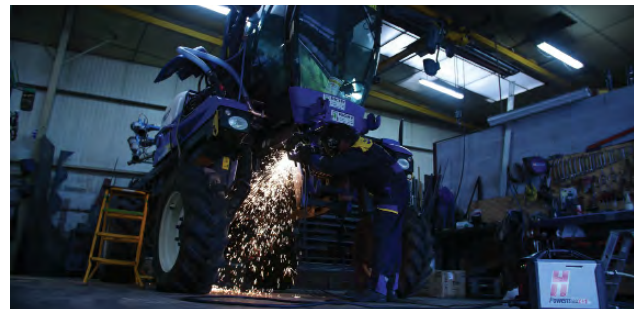
Wartung von landwirtschaftlichen Geräten