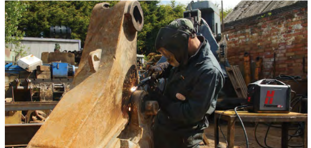
Wartung und Reparatur